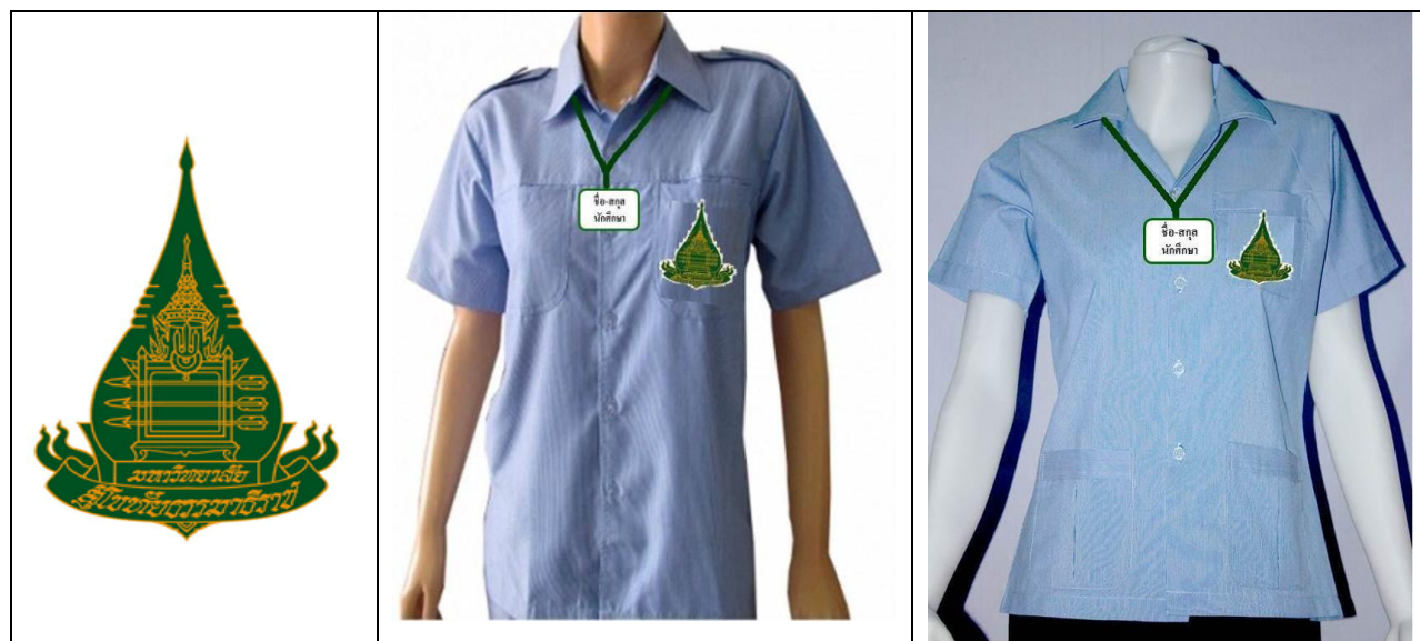
ภาพที่ 1 การแต่งกายนักศึกษาชาย - หญิง

ชุดวิชานี้กำหนดให้นักศึกษาชายและหญิงสวมเสื้อเครื่องแบบเจ้าหน้าที่สาธารณสุขสีฟ้ารีวขาวติดตรามหาวิทยาลัยสุโขทัยธรรมราชา (นักศึกษาสามารถหาซื้อได้ที่สหกรณ์ร้านค้า มสธ.) มาสอยติดกระเป๋าเสื้อด้านซ้าย (ในกรณีที่ไม่มีกระเป๋าสามารถติดตรงอกข้างซ้ายเช่นกัน) รวมทั้งแขวนป้ายชื่อบัตรนักศึกษาพลาสติกห้อยคอ นักศึกษา และสวมกางเกงขายาว ทรงสแลคสีดํา สวมรองเท้าหุ้มส้นสีสุภาพ (ดังภาพที่ 1)